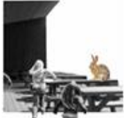
A. Naturrum / Udendørs opholdsrum og formidling