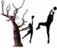
1 - 4 Aktivitetssteder