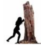
7 - 8 Aktivitetssteder