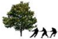
5 - 6 Aktivitetssteder