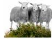
B. Afgræsset overdrev